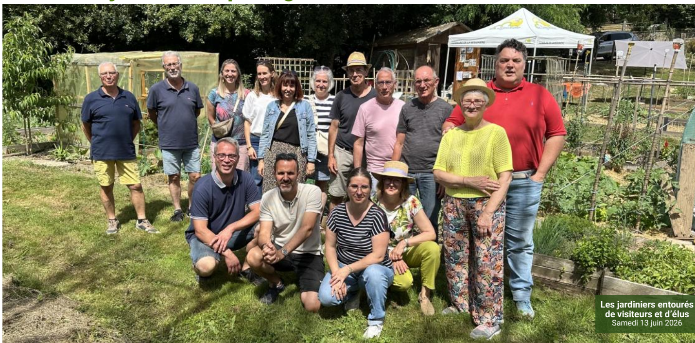
Les jardiniers entourés de visiteurs et d'élus Samedi 13 juin 2026

Une belle journée de partage sous le soleil