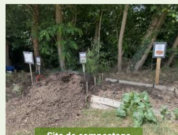
Site de compostage

Le composteur collectif est désormais pleinement opérationnel. Alimenté régulièrement par les déchets végétaux issus des parcelles, il fait l'objet d'une gestion rigoureuse par les jardiniers. L'équilibre entre matières sèches et matières humides est soigneusement respecté afin de garantir une bonne décomposition.