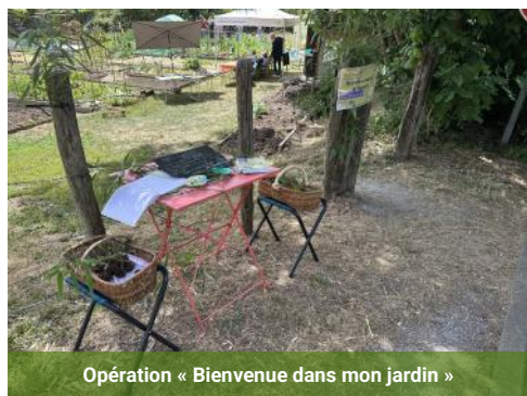
Opération « Bienvenue dans mon jardin »

Sous un beau soleil printanier, quelques visiteurs sont venus découvrir cet espace de jardinage collectif situé en bord de Moine, à proximité du Moulin de la Cour. Pour les accueillir dans une ambiance chaleureuse, les jardiniers avaient aménagé un espace extérieur de collation propice aux échanges et aux discussions autour des pratiques de jardinage au naturel.