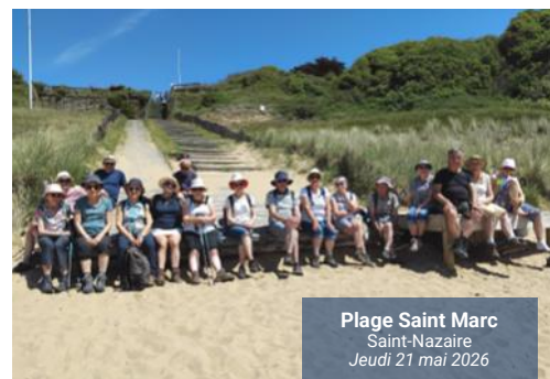
Plage Saint Marc Saint-Nazaire Jeudi 21 mai 2026

Toutes les informations sur : verts-horizons.cubeo.com