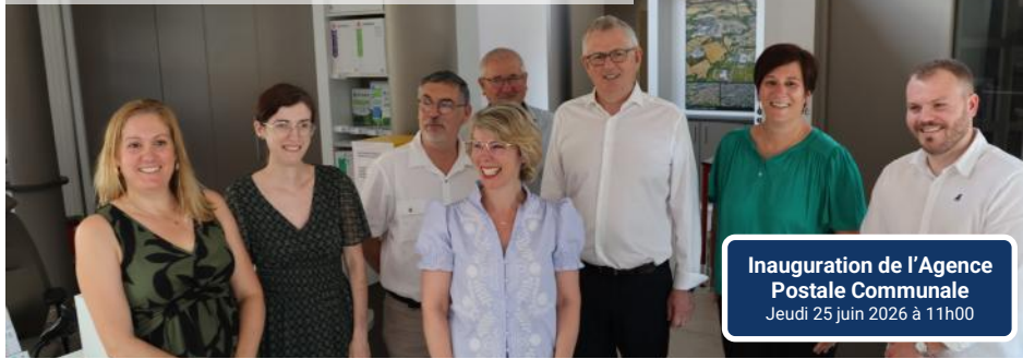
Inauguration de l'Agence Postale Communale Jeudi 25 juin 2026 à 11h00