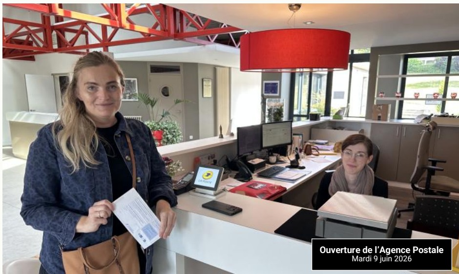
Ouverture de l'Agence Postale Mardi 9 juin 2026

L'inauguration de ce nouvel espace a eu lieu le jeudi 25 juin en présence des représentants de La Poste (voir page 11).