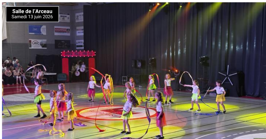
Salle de l'Arceau Samedi 13 juin 2026

Au moment où le rideau tombe sur son 30 ème gala, une chose est certaine : derrière les projecteurs, les musiques et les émotions partagées, c'est une part importante de l'histoire associative de la commune qui salue aujourd'hui l'un de ses artisans les plus passionnés.