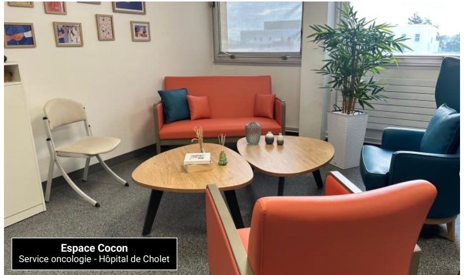
Espace Cocon Service oncologie - Hôpital de Cholet

Mi-janvier, les couturières du Léopard Textile, groupe sous l'égide du CSI Ocsigène, ont eu le plaisir de visiter la nouvelle salle cocon récemment ouverte au service d'oncologie de l'hôpital de Cholet.