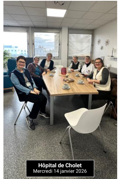
Hôpital de Cholet Mercredi 14 janvier 2026

Les bénévoles remercient toutes celles et ceux qui, par leur achat, participent à cette belle aventure solidaire.