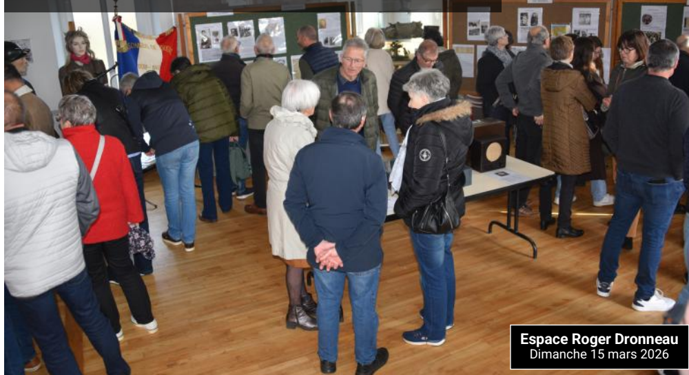
Espace Roger Dronneau Dimanche 15 mars 2026