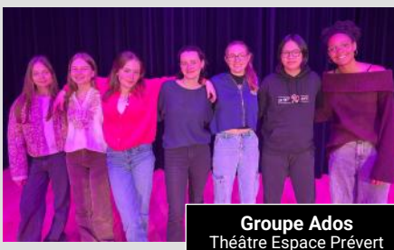
Groupe Ados Théâtre Espace Prévost

Vous êtes invités à venir encourager et découvrir ces jeunes talents.