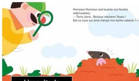
L'enquête de monsieur Monsieur

pages en feutrine invitent l'enfant à chercher et à toucher. Le petit dernier arrivé à la bibliothèque, "Tu as le droit !", explore quant à lui les droits des enfants et ouvre un bel espace de dialogue entre parents et enfants.