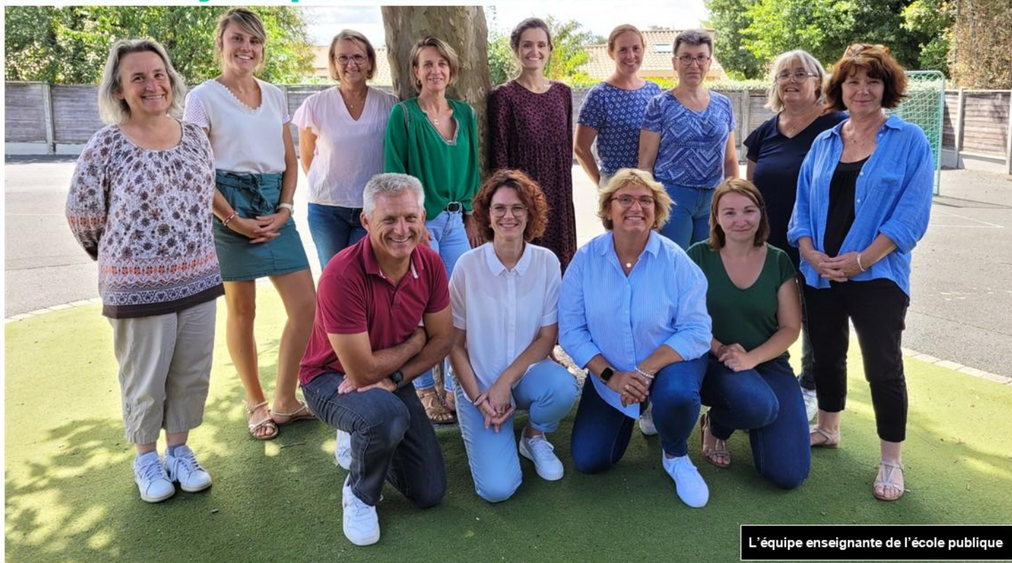
L'équipe enseignante de l'école publique

La rentrée 2024/2025 s'est déroulée sous le signe de la continuité et du dynamisme dans les deux établissements scolaires, Notre-Dame et Marcel Luneau.