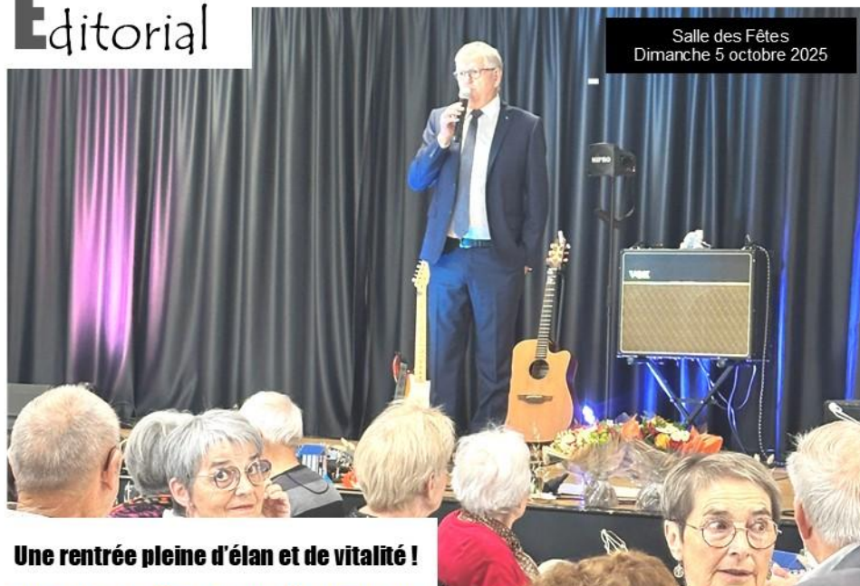
Salle des Fêtes Dimanche 5 octobre 2025