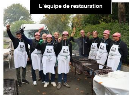
L'équipe de restauration

Pour tout renseignement complémentaire, il est possible de contacter les organisateurs : svs.cyclovtt@gmail.com